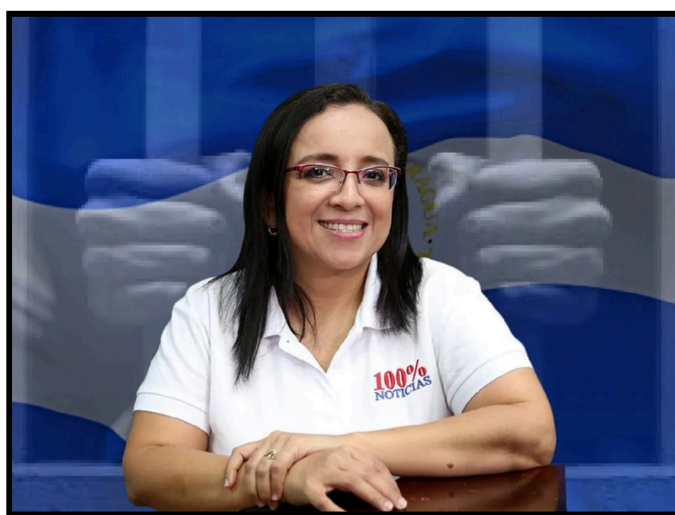
Lucía Pineda: Premio Internacional Coraje en Periodismo (IWMF, 2019).