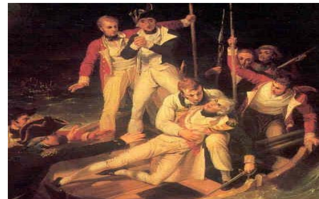
Copia de “Horacio Nelson herido” de Richard Westall (Museo Histórico Militar de Almeyda)