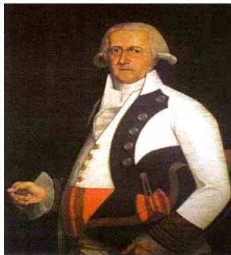
General Gutiérrez (Museo Histórico Militar)