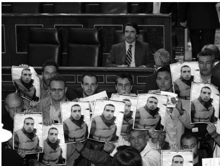
Protesta de los fotógrafos en el Congreso, ante los escaños del Gobierno.

y se limitó a señalar que sólo tenía conocimiento de que era peligroso permanecer en Iraq, por lo que recomendó por dos veces abandonar el país, sobre todo después de conocer que un grupo de periodistas tenía pensado organizar un convoy para salir de Bagdad hacia Jordania. Mien-