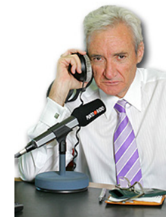
Luis del Olmo