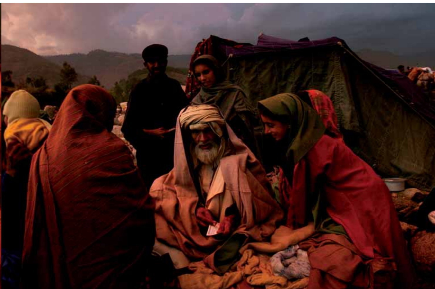
Tomás Munita. Kashmir; “Escenas llenas de vigor que muestran el drama humano”.