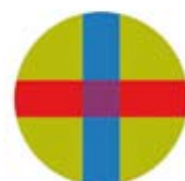
Universidad CEU San Pablo