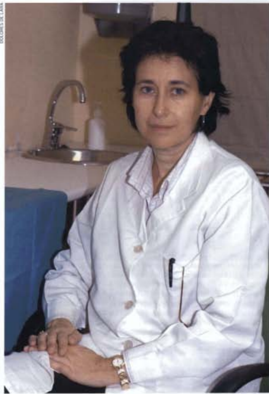
DOLOR DE LATA

las depresiones, ansiedades hasta la patología oncológica. En los enfermos que siguen un tratamiento de quimioterapia, por ejemplo, la acupuntura puede paliarles muchos efectos secundarios, lo cual mejora el estado general del paciente. Con ello se le evitan las náuseas, los vómitos, el decaimiento. El estado general del paciente mejora. Muchas veces me comentan que lo único que notan es la alopecia. En otra patología donde se consiguen buenos resultados es en el sida. No solamente disminuye los efectos secundarios, sino